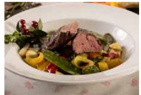
Gegrillter Rehrücken mit Wokgemüse