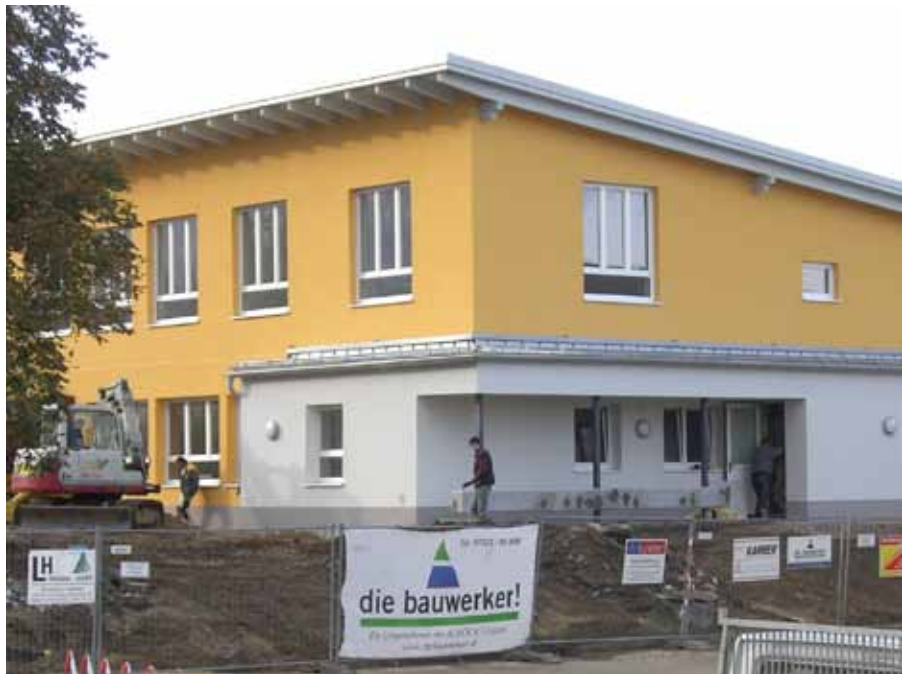
Kindergarten der Pfarrcaritas - Arbeiten an der Außenanlage

Danke aber auch den Damen vom Kindergarten, weil sie mit Übergangslösungen zurechtkommen und Kompromisse vielfach mit Unannehmlichkeiten verbunden sind. Nun ist die Fertigstellung aber schon in Reichweite und wir alle freuen uns über das moderne Gebäude.